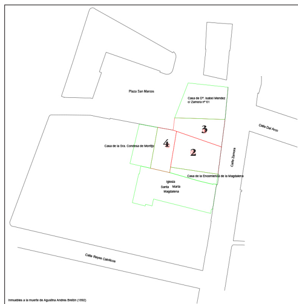
FIGURA 1: Plano de posesiones en 1893.