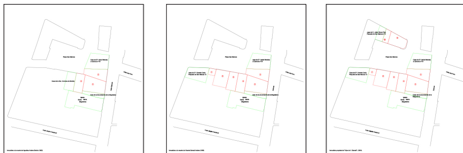
FIGURA 4: Plano de posesiones en 1893, 1900 y 1904.

Visto esta información, observemos los cambios acaecidos en esta manzana debido al desarrollo de la industria familiar de los Bomati. Con fondo gris, las posesiones de la Familia Bomati.